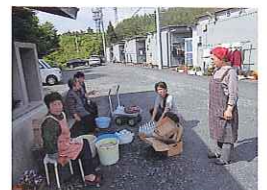
仮設住宅での井戸端会議

最近では、仮設団地ごとに支援連絡員が配置され、各戸の見回りが行われています。支援連絡員の方は、「支援物資は少なくなりましたが、これからは物の支援より精神面でのケアの支援が重要」と話していました。