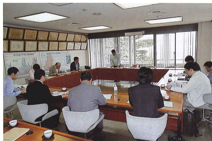
重茂漁協参事からの説明風景

岩手大学では、三陸の水産業の復興のため、今後も地元の方々との話し合い等を通じて積極的に活動していきます。