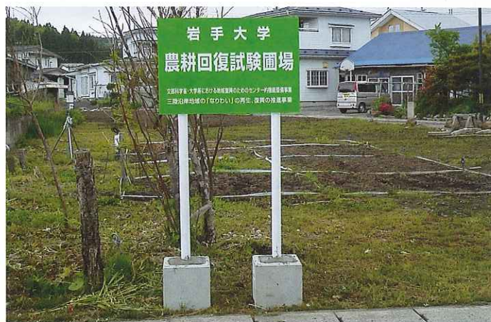
久慈市内の実験区