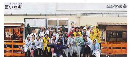
柕ヶ沢ベースオープニングイベントにて